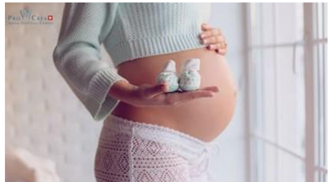
150 Babies noch auf dem Weg