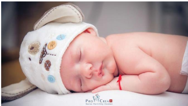
258 geborene Babies bis 31.12.2018